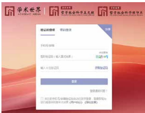
“哲社预印本”登录页面截图

当用户需要提交研究成果时，身份自动转化为作者用户，依据“2. 作者用户”流程进行操作。