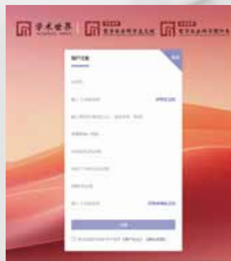
“学术世界”平台注册页面截图

特别说明：“哲社预印本”是“学术世界”的子平台之一，只需注册/登录一次，便可以访问3个平台：“学术世界”主平台、“哲社预印本”子平台和“哲社文献”子平台。